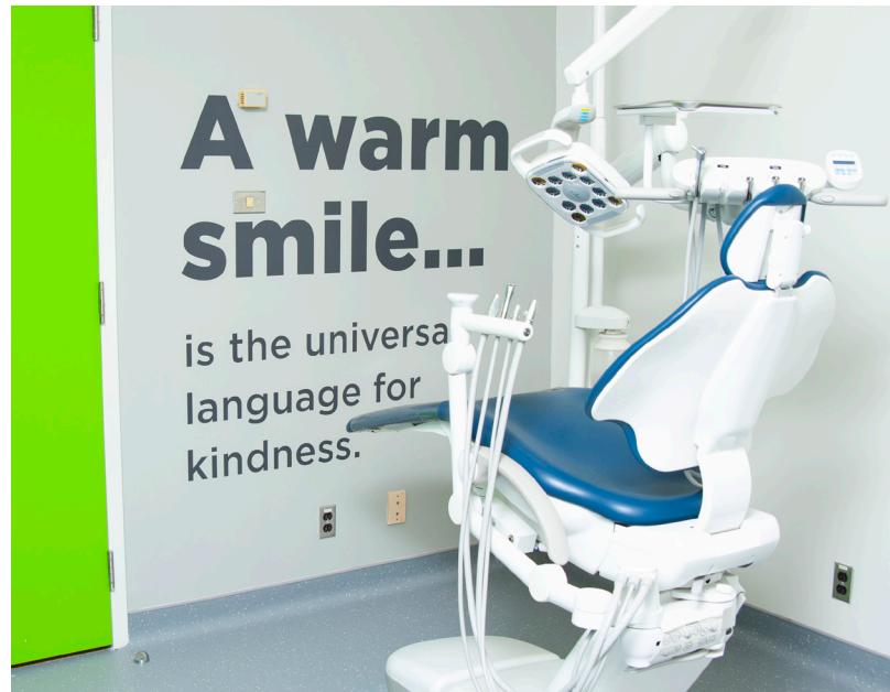
Les investissements de GreenShield Communautaire financent les cliniques de santé buccodentaire afin de fournir un accès aux soins pour les Canadiens et Canadiennes issus de communautés mal desservies.

Pour y arriver, GreenShield Communautaire s'est engagée à investir 75 millions de dollars dans le but ambitieux d'avoir une incidence positive pour au moins un million de Canadiens d'ici 2025 en favorisant des améliorations mesurables des résultats sur la santé.