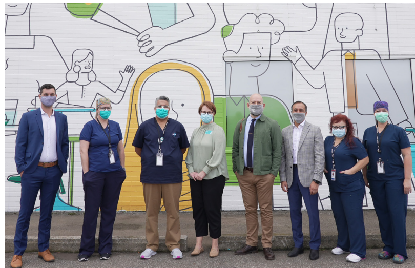
Le dévoilement de la murale d'une clinique dentaire située à Niagara Falls et financée par GreenShield.

GreenShield Communautaire s'est engagée à investir plusieurs millions de dollars dans la santé buccodentaire, notamment dans des villes et des communautés rurales de sept provinces : Alberta, Colombie-Britannique, Manitoba, Nouvelle-Écosse, Ontario, Québec et Saskatchewan.